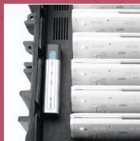
Kabelloses Arbeiten, Surfen und Installieren durch den Wireless Access Point