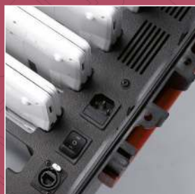
Zentrales Lademanagement für alle Geräte mit integrierter Gerätekühlung