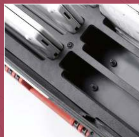
Automatisches Andocksystem zum einfachen Aufladen der Geräte