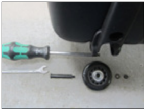
Montagematerial im Überblick