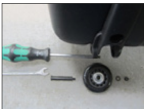
Overview of mounting materials